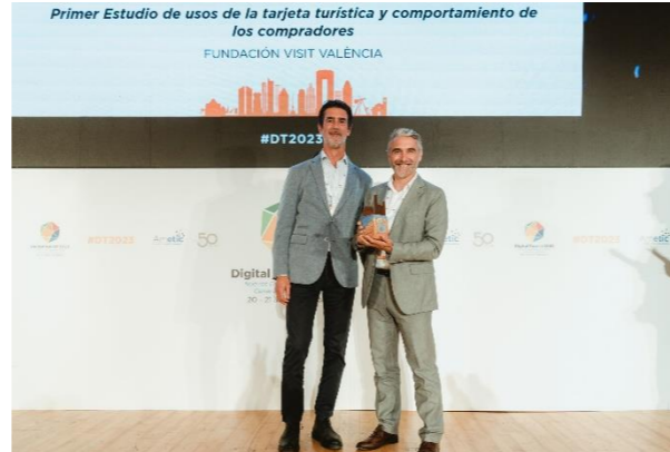
FUNDACIÓN VISIT VALÈNCIA Gestión del Dato Turístico en DTIs