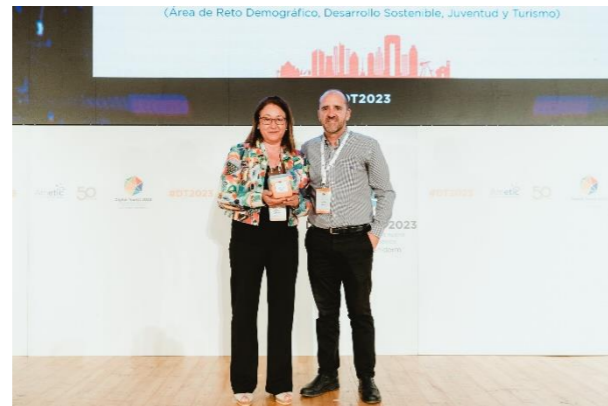
DIPUTACIÓN DE CÁCERES Inteligencia Turística para Destinos de Interior