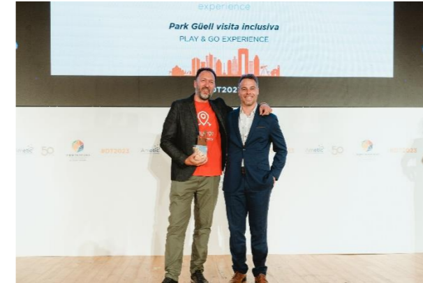
PLAY&GO EXPERIENCE Mejora de la Accesibilidad Universal Turística