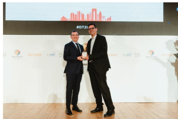
PLAYAS DE ALICANTE Innovación de Gestión de Flujos Turísticos