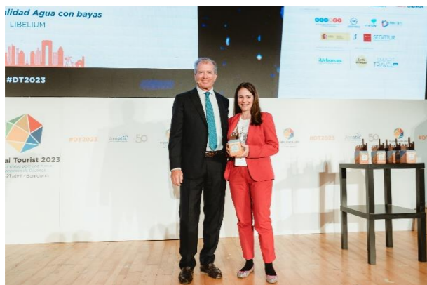
LIBELIUM Inteligencia Turística para el Turismo Azul