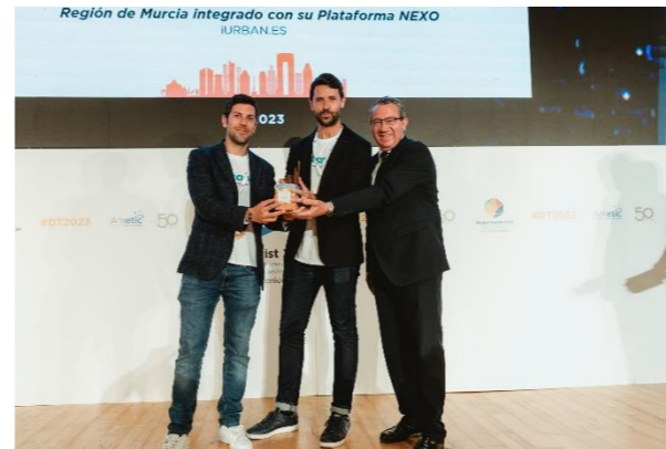
iURBAN.es Nodo de Inteligencia Turística