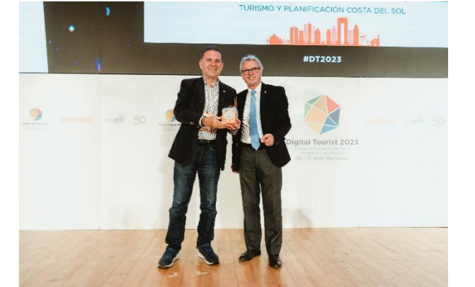
COSTA DEL SOL Proyecto de Sostenibilidad Turística