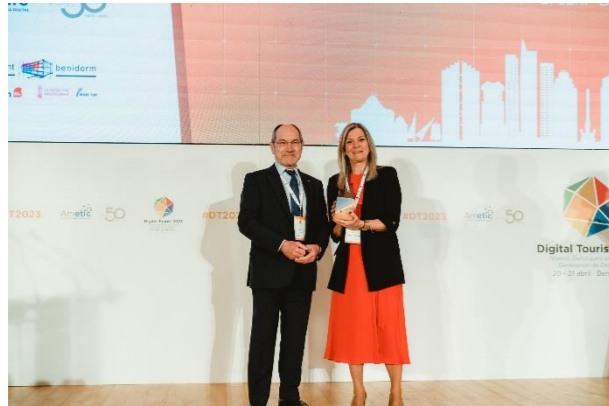
PRINCIPADO DE ASTURIAS Comunidad Autónoma Invitada Digital Tourist 2024