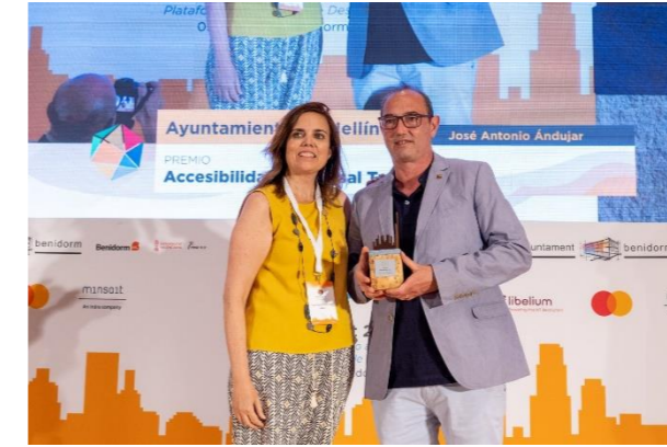
AYUNTAMIENTO DE HELLIN Accesibilidad Universal Turística