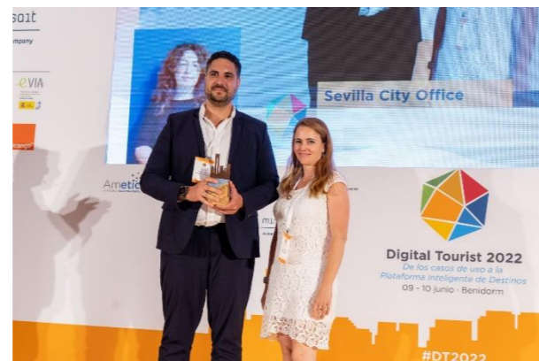
SEVILLA CITY OFFICE Gestión del Flujo Turístico