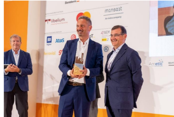
BOSCH SERVICE SOLUTION Normalización y Semántica del Turismo Digital