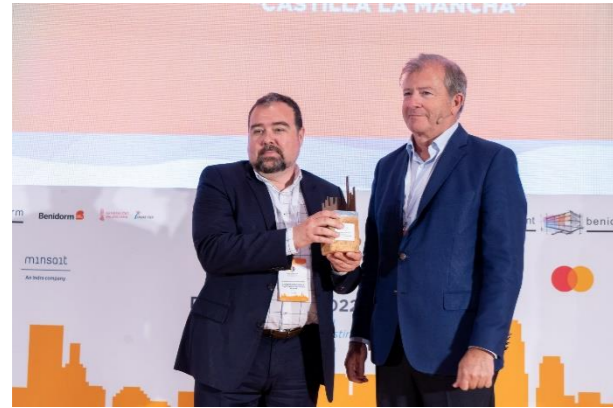
CASTILLA LA MANCHA Comunidad Autónoma Invitada Digital Tourist 2022