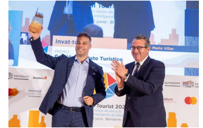
INVAT-TUR Gestión del Dato Turístico