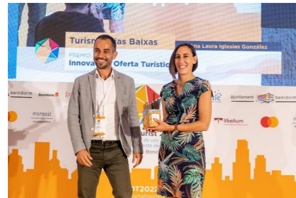
TURISMO RIAS BAIXAS- DIP. DE PONTEVEDRA Innovación en la Oferta Turística