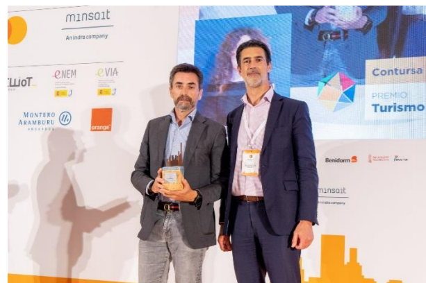
CONTURSA - SEVILLA CITY OFFICE Agenda 2030