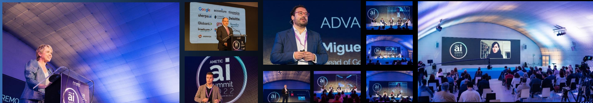
Imágenes de la AMETIC Artificial Intelligence Summit 2022 abril 2022

El evento congregará a proveedores, usuarios y potenciales de IA , que tendrán la oportunidad de escuchar conferencias de alto nivel realizadas por ponentes de referencia y prescriptores en torno a las nuevas tendencias, temáticas de interés y casos de éxito en la aplicación de la Inteligencia Artificial en los ámbitos social e industrial. Además, los asistentes podrán potenciar el networking y descubrir la zona de exposición virtual de IA.