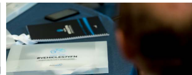
Imágenes de la Edición de 2018