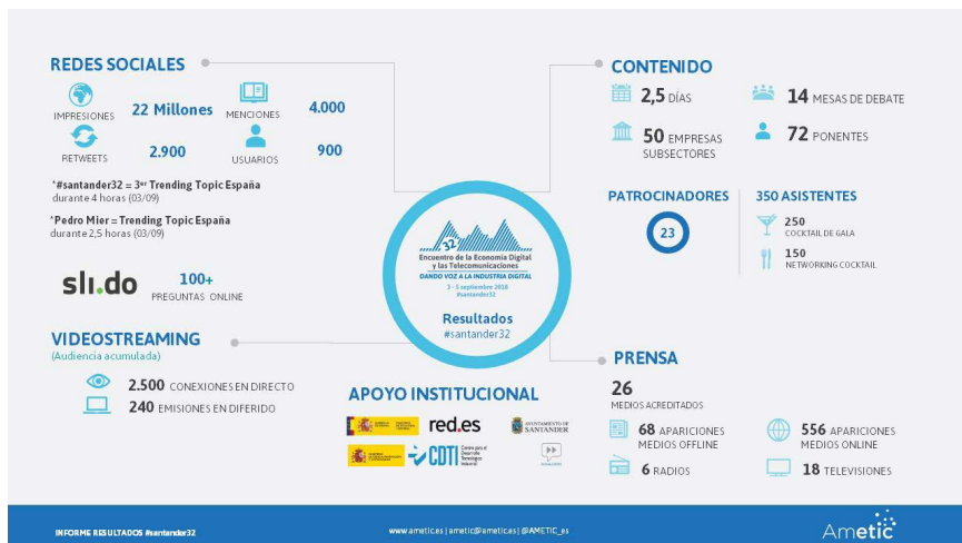
Informe de resultados #santander32