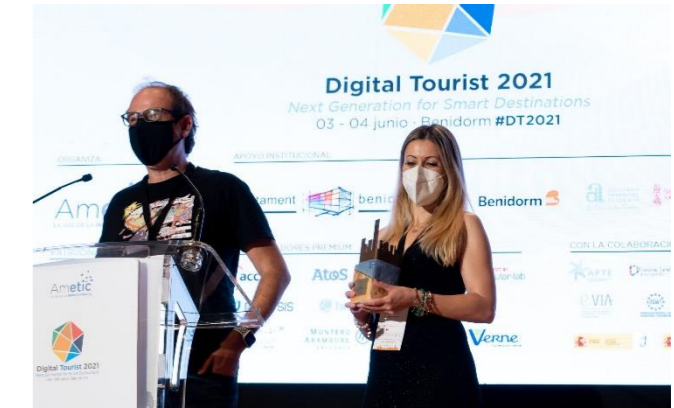
PAYTHUNDER Digitalización de Comercio Turístico