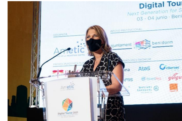
FYCMA Turismo seguro: Protocolos de Seguridad Sanitaria