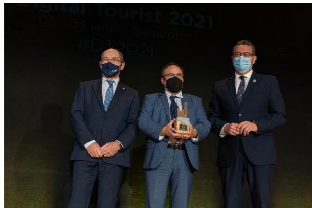
EXTREMADURA Comunidad Autónoma Invitada Digital Tourist 2021