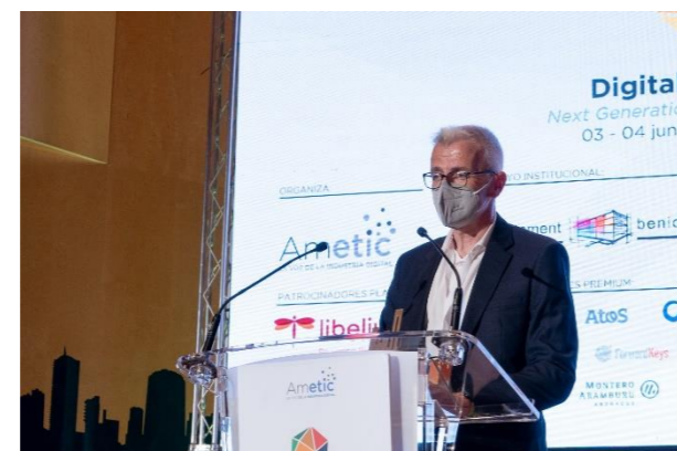
AEROPORTS DE CATALUNYA Gestión del Flujo Turístico