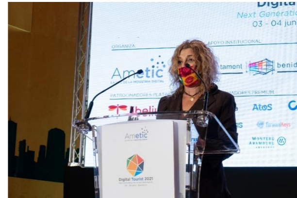
TIERRA BOBAL Normalización