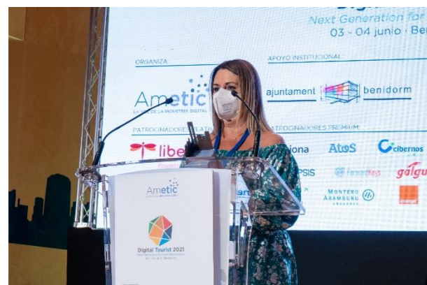
HOSBEC Economía del Dato Turístico