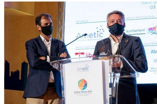
TURISMO DE CANARIAS Y ATOS Innovación en la Oferta Turística