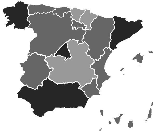
Oportunidades CPI Año 2019