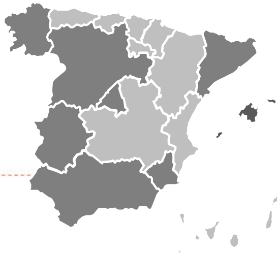
Oportunidades CPI Año 2017